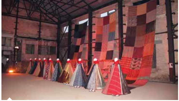
ATHİB 10. Dokuma Kumaş Yarışması'nda finale kalmayı başaran genç tasarımcılar büyük heyecan yaşadı.