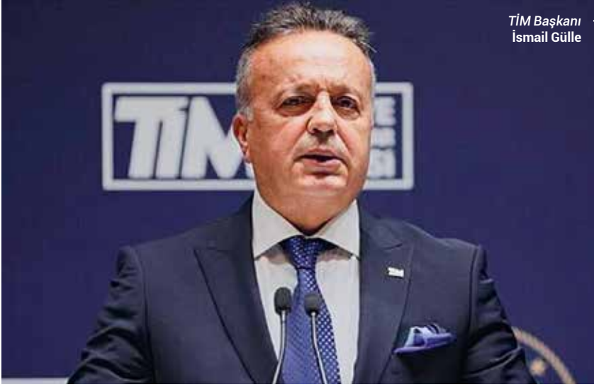
TİM Başkanı İsmail Gülle