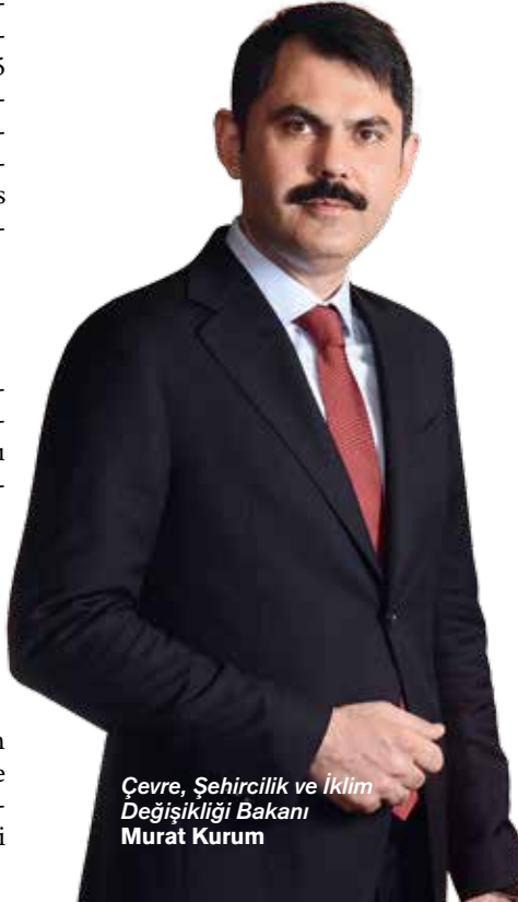
Çevre, Şehircilik ve İklim Değişikliği Bakanı Murat Kurum

bir mücadele içine girdiler. Türkiye olarak biz de bu mücadelenin en önemli ülkelerinden biriyiz." dedi.