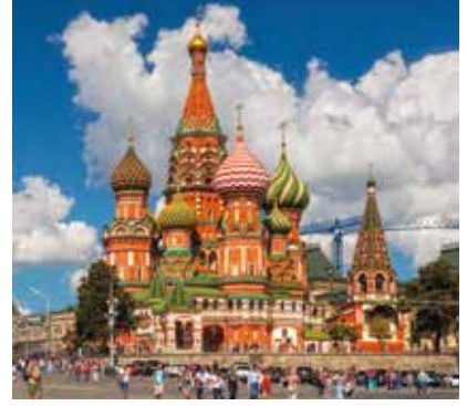
Türkiye, Rusya pazarında Ocak-Eylül döneminde en yüksek değerlere yaş meyve sebze, otomotiv ve kimyevi maddeler ve mamulleri sektörlerinde ulaştı.

belirtiliyor. Yaklaşık 75 milyon Rus vatandaşın e-ticaret platformları üzerinden alışveriş yaptığı, söz konusu satışlarda ev eşyalarının yüzde 28, hazır giyim ve ayakkabının yüzde 21, gıda ve yemek hizmetlerinin yüzde 10 pay ile öne çıktığı ifade ediliyor. Rus vatandaşların sınır ötesi e-ticaret sitelerinden gerçekleştirdiği alışverişin parasal değerinin ise 2020 yılında yüzde 78 artarak 9,8 milyar dolar düzeyine ulaştığı belirtiliyor.