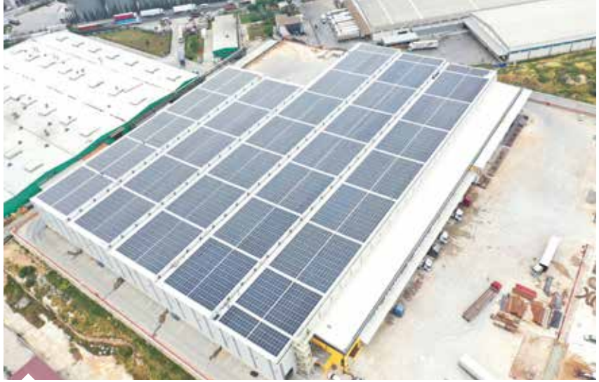
IDS Enerji, sanayi kuruluşlarında çatı tipi güneş enerjisi santrallerinin kurulumunu gerçekleştirirken enerji şirketlerinin arazi tipi güneş enerjisi santrali yatırımlarını da gerçekleştiriyor.