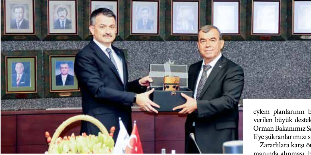
Başkan Nejdat Sin, Akdeniz İhracatçı Birlikleri'nde yaş meyve sebze sektörünün dinamikleriyle bir araya gelen Tarım ve Orman Bakanı Bekir Pakdemirli'ye ziyaret anısına hediye takdim etti.